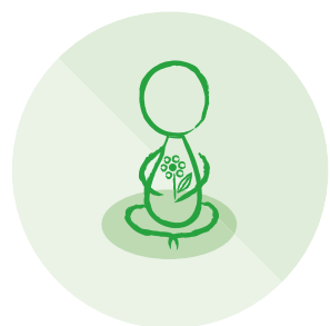
Vern mot overgrep