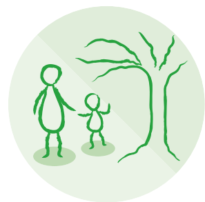
Særskilt vern og støtte