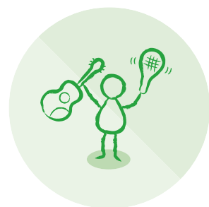
Kultur og fritid