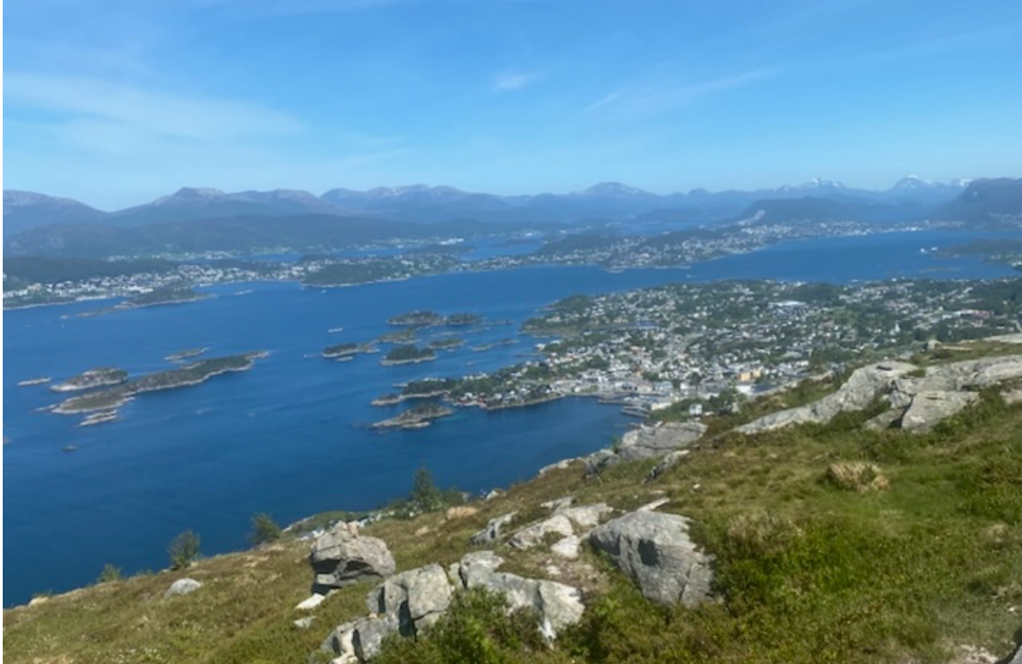
Utsikt frå Sulafjellet